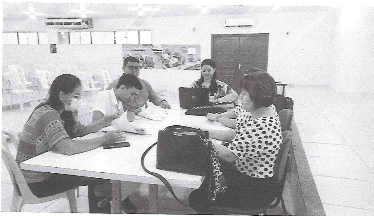
Russas – CE; 05 de maio de 2022.

OBJETO: REGISTRO DE PREÇOS PARA FUTURAS E EVENTUAIS AQUISIÇÕES DE FARDAMENTOS, SANDÁLIAS E TÊNIS ESCOLARES PARA O USO DOS ALUNOS DA REDE PÚBLICA MUNICIPAL DE ENSINO DE RUSSAS-CE, CONFORME AS ESPECIFICAÇÕES E QUANTITATIVOS PREVISTOS NESTE TERMO DE REFERÊNCIA.