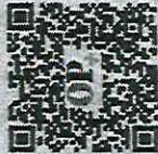
Aponte a câmera do celular e acesse mais notas exclusivas de Erico Firmo.

A 48 horas do começo do governo Elmano, ainda não foram confirmados alguns dos nomes do secretariado. Chama atenção a importância deles: Casa Civil, por exemplo. É o coração do governo. Normalmente, governos começam a ser montados por aí. Falta também a infraestrutura. Uma pasta das mais sensíveis. Consome grande volume de investimentos. Se funcionar, é um dos alcerces da construção da imagem do governo. Se der errado, tem enorme potencial para escândalos, de obras atrasadas e inacabadas até o risco de desvio de dinheiro mesmo. Falta também Ciência e Tecnologia. Se a demora for sinal da relevância que o setor terá, equivalente às duas citadas anteriormente, é bom sinal.